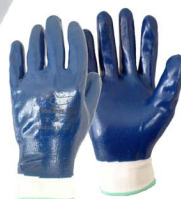
Variante Mod.510PF: Todo cubierto